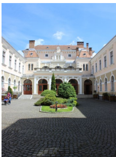
Székelyudvarhely: Városháza, 1896

Székelyudvarhely az Udvarhelyi-medence gazdasági és művelődési központja. Hargita megye második legnépesebb városa. Székelyföld történelmi, társadalom- és művelődéstörténeti központja, s évszázados hagyományokra visszatekintő székhelye. 2002-ben 36 926 lakosából 35 315 magyar (95, 62%) és 1087 román (2,91%) anyanyelvű volt. A lakosság felekezeti összetétele (50% római katolikus, 45% protestáns, főleg református és unitárius).