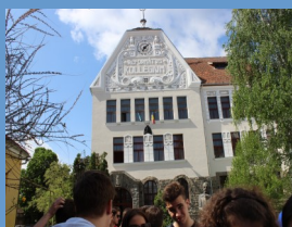
A Református Kollégium épülete