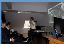
A projekt nyitórendezvénye