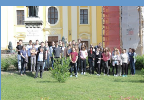
Néhány pillanatkép a tanulmányútról